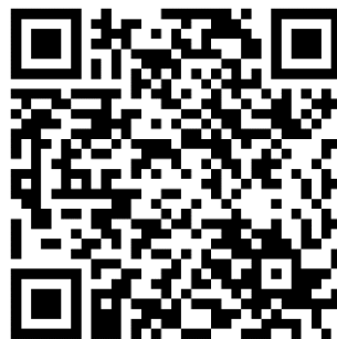
QR code για την διεύθυνση

Για περισσότερες πληροφορίες σχετικά με τη λειτουργία του εξοπλισμού, μπορείτε να απευθύνεστε στους υπευθύνους των αιθουσών, ενώ μπορείτε να ενημερώνεστε σχετικά με τις προσφερόμενες υπηρεσίες στην αναλυτική σελίδα οδηγιών: https://it.auth.gr/manuals/e-manual-classrooms-type-abc/