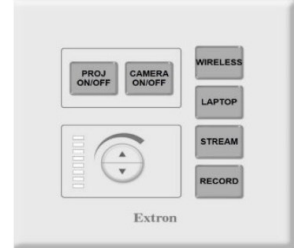
Ένδειξη ότι δεν υπάρχει ρεύμα στον χώρο