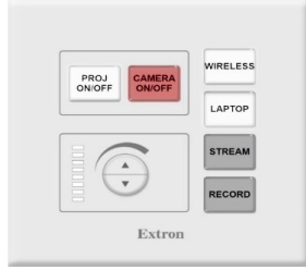
NBP έτοιμο για προβολή