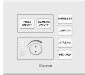
Ένδειξη ότι δεν υπάρχει δίκτυο στον χώρο